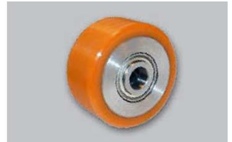
Art.-Nr. 0255965 / 0055121