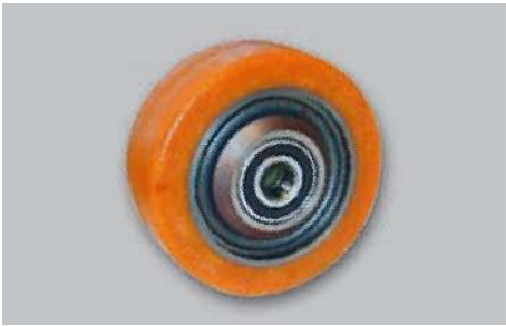
Art.-Nr. 5061784 / 5096490